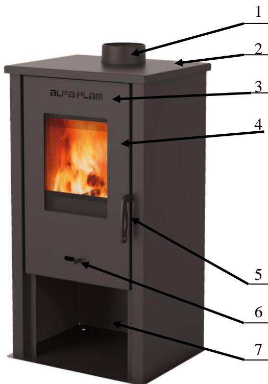
Slika 1. Peć na čvrsto gorivo

UPOZORENJE: Temperatura u prostoru ispod ložišta je previsoka. Ovaj prostor se ne sme koristiti za skladištenje zapaljivih materijala ili goriva (slika 1, pozicija 7).