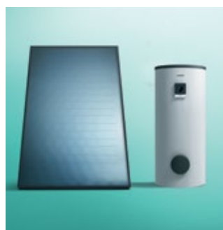
Kolektor + spremnik