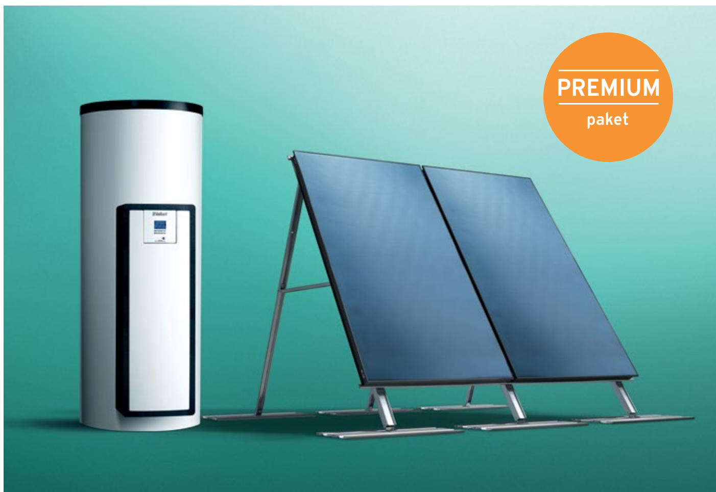
Solarni spremnik s „drain-back“ modulom te kolektorom