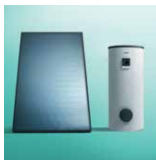
Kolektor + spremnik