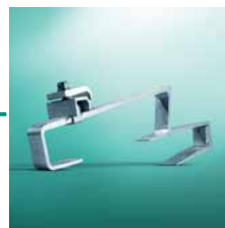
Krovni nosač Tip P (standardni crijep)