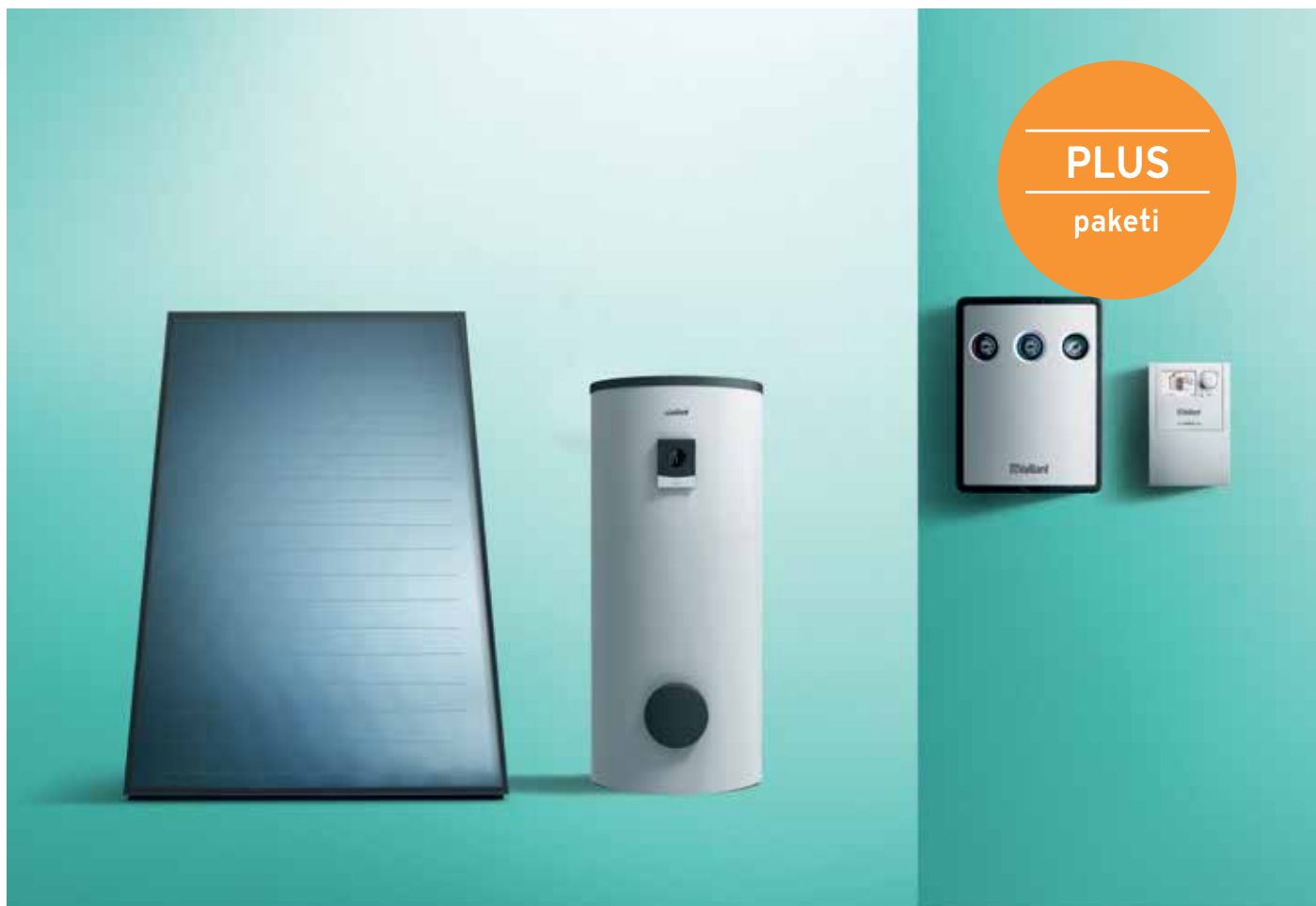
Prikaz solarnog paketa VIH PLUS sa spremnikom

Solarni akcijski paketi PLUS VIH 300 i PLUS VIH 500 kompletni su paketi za solarnu pripremu potrošne tople vode putem kojih je moguće uštedjeti godišnje i do 60% potrebne energije u zagrijavanju tople vode. Brzom povratu investicije svakako će pridonijeti pouzdana i dugotrajna tehnologija.