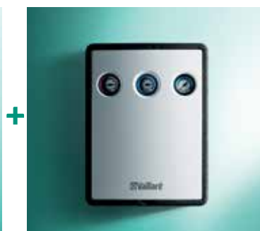
Solarna cijevna grupa